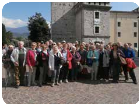
Légende photo : Groupe au château de RIVA (extrémité nord du lac de Garde).

Les réunions des mardi et jeudi salle 3 du Centre culturel se poursuivent avec scrabble, belote et tarot.